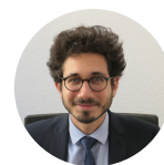
Thibaut Félix Sous-Préfet à la Relance