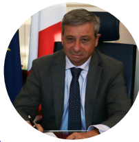
Etienne Guyot Préfet de la région Occitanie Préfet de la Haute-Garonne

L'année 2021 a été marquée par le retour à une vie plus normale pour l'ensemble de nos concitoyens, grâce à l'arrivée des vaccins, mais aussi grâce aux efforts de l'Etat à maintenir une activité économique et sociale aussi performante et résiliente que possible. Je salue la détermination des services de l'Etat dans leur volonté d'accompagner la société toute entière à surmonter la crise sanitaire suivie d'une crise économique. Croyons que l'année qui commence nous mènera vers une pleine réussite aussi bien dans nos vies que dans nos espaces collectifs.