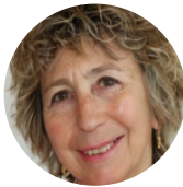
Catherine Hugonnet Députée aux Droits des femmes