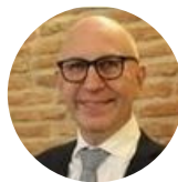
Eric Pélisson Commissaire à la prévention et à la lutte contre la pauvreté