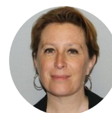
Delphine Mercadier Commissaire à l'Aménagement du Massif des Pyrénées