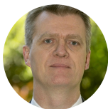
Florent Guhl Directeur Régional de l'Agriculture de l'Alimentation et de la Forêt